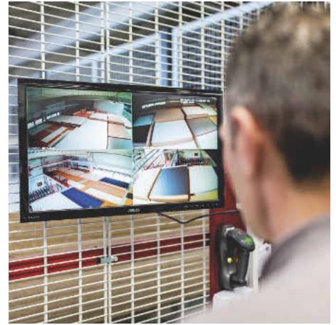
/ Sinnvoll eingesetzte Überwachungssysteme bieten permanenten Einblick ins Plattenlager.